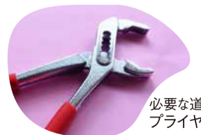
必要な道具 プライヤー