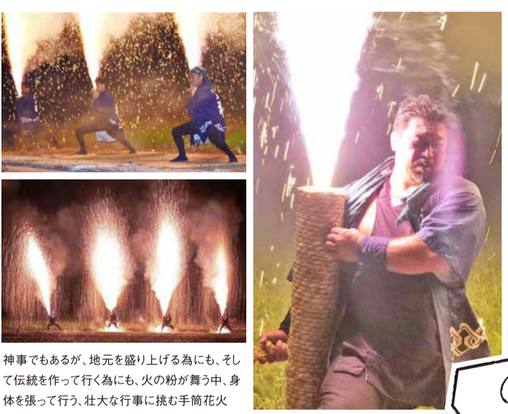
神事でもあるが、地元を盛り上げる為にも、そして伝統を作っていく為にも、火の粉が舞う中、身体を張って行く、壮大な行事に挑む手筒花火

訪問営業をきっかけに瓦屋根工事をしたお客様から「連絡がとれない」「会社が遠い場所にあった」などのご相談を受けて、うちでアフターケアの担当を