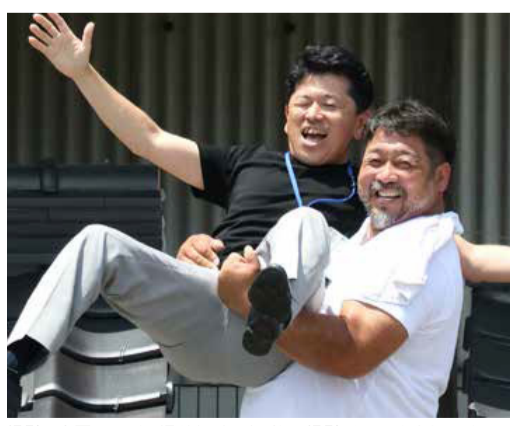
撮影は真夏日でした。汗だくになりながらの撮影、おつかれさまでした…。 お便りやカルチャー教室、スポーツ教室など、取り上げてほしい情報は弊社までご連絡ください。

誌面タイトル「すずるっ」は、佐賀弁で「液状物が溢れる」という意味で、飲み物を注ぎ過ぎたり、お風呂の水を止め忘れたりして困ったときに使う方言ですが、住環境の「困った」を郷土愛溢れる(すずれる)職人を繋いで解決したいという思いで命名しました。 「地元の工務店で家を建てたけど今は廃業されて、どこに相談していいかわからない」という方に、信頼と安心して相談できる職人さんを紹介するプラットフォームの役割をこの誌面が果たせたら最上の喜びです。