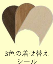
3色の着せ替え シール